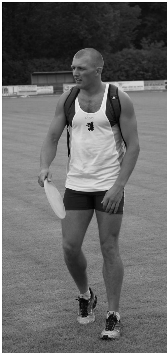
Domažlický dres zdobí tradičně hlava psa.