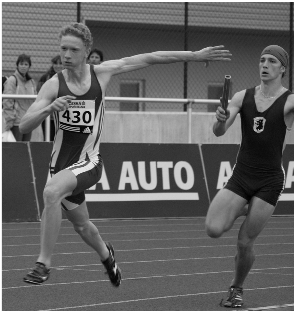
Pátá štafeta z mistrovství republiky do 22 let musí umět předávat.